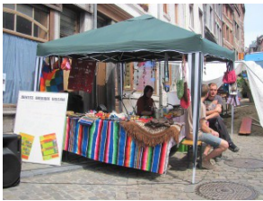
Stand à la fête en Pierreuse

Le 2 juin , nous étions à la fête de Liège en transition , où nous avons proposé des animations sur les pâtés végétaux et une démonstration de vannerie.