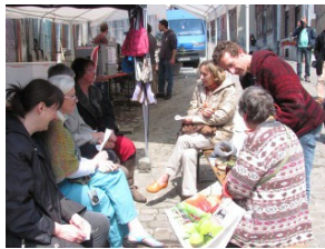
Dégustation plantes sauvages