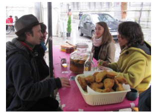
Empanadas & maitrank